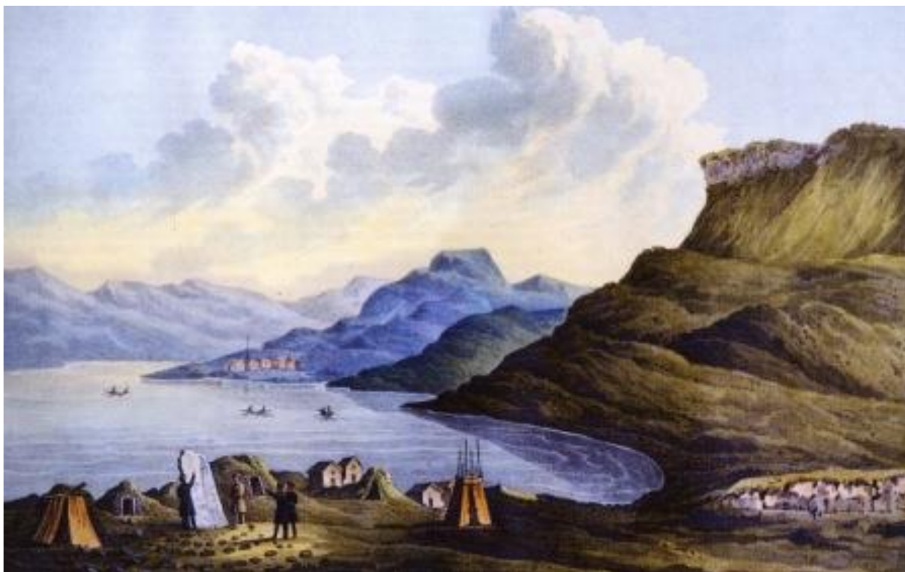
Карл Редер «Лабиринт. Варангер-фиорд», 1840. Литография с авторской акварельной раскраской